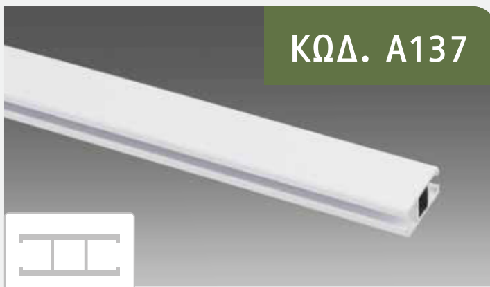
Προφίλ Οπτικής Απομόνωσης

Σετ οπτικής απομόνωσης παρέχεται σε νοσοκομειακούς και ιατρικούς χώρους για την κάλυψη και την προστασία του ασθενή από μικροβία.