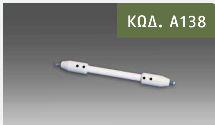
Αντίριδα Οπτικής Απομόνωσης